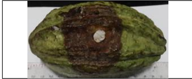
Gambar 1. Penyakit busuk buah kakao “Black pod disease” (BPD), disebabkan jamur Phytophthora palmivora (E. J. Butler)