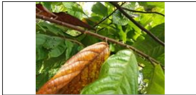
Gambar 3. Penyakit mati pucuk Vascular Streak Dieback (VSD) disebabkan oleh jamur Oncobasidium theobromae

Gejala serangan VSD dimulai dengan menguningnya daun ke 2 atau ke 3 dari ujung ranting dan terdapat bercak-bercak hijau pada daun. Selanjutnya berkembang hingga keseluruhan permukaan daun berwarna kuning kecoklatan dan akhirnya akan gugur sehingga ranting terlihat seperti ompong (Harni dan Baharuddin, 2014). Bekas duduk daun terdapat tiga noktah berwarna