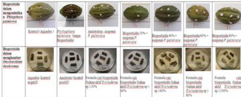
Gambar 3. Metode pengendalian ramah lingkungan, telah diteliti dalam skala laboratorium, seperti terlihat pada gambar ini.

coklat kehitaman. ranting yang sakit apabila dibelah membujur akan terlihat adanya garis-garis coklat pada jaringan xilem (Keane et al. 1972). selanjutnya, kematian jaringan akan menjalar sampai cabang atau ke batang utama sehingga tanaman mati (Guest dan Keane, 2007)